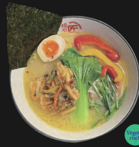
ベジホワイトポタージュラーメン Veggie White - Potage Ramen 17,00 €

Intensiv sanfte plant based Potage Brühe Basis-Toppings inkl.: Ajitama Ei, Hähnchenhack gebraten, Naruto, Sojasprossen, Schnittlauch, Naruto, Sojasprossen, Schnittlauch,