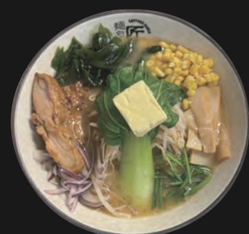
札幌味噌バターラーメン Sapporo Style Miso Butter Ramen 16,50 €

Kombu-Algen-Brühe auf sanft-milder Sojasoßen-Basis nach Takumi-Art Basis-Toppings inkl.: Veggie-Tempura-Stück, Sojasprossen, Schnittlauch, rote Zwiebelringe, Paprika, Baby-Pakchoi