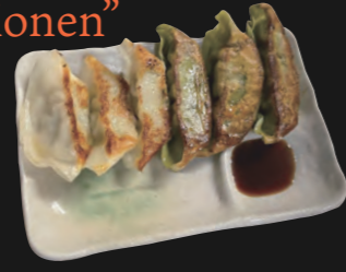
麻辣餃子 Mala Gyoza

mit chinesischem Mala Gewürz (pikant) & frischem Koriander