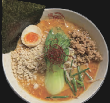
坦々麺 TanTan-Men 18,00 €

Hühnerbrühe auf pikant-scharfer Miso-Basis und scharf gewürzte Sojasprossen Spicy Ramen-Variante Toppings inkl.: Chicken-Teriyaki Stücke, scharf gewürzte Sojasprossen, Schnittlauch, Menma (=eingelegte Bambusstücke), Baby-Pakchoi