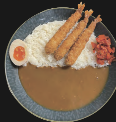
エビフライカレー