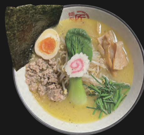
ホワイトポタージュラーメン White - Potage Ramen 17,00 €

Mala Nouko Ramen - Unsere Spezialität mit extra lang eingekochter Brühe und frischem Koriander (pikant scharf) Basis-Toppings inkl.: Ajitama/Ei, Hähnchenhack gebraten, scharf gewürzte Sojasprossen, Schnittlauch, Koriander, Baby-Pakchoi, Norialgenblatt, (optional mit 2 St. Karaage)