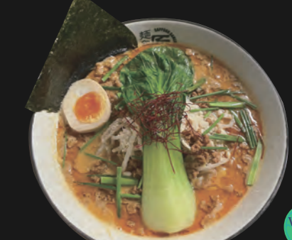
ベジ坦々麺 Veggie TanTan-Men 18,00 €

Kombu-Algen-Brühe auf pikant-scharfer Miso-Basis und scharf gewürzte Sojasprossen Spicy Ramen-Variante Toppings inkl.: Veggie-Tempura-Stück, scharf gewürzte Sojasprossen, Schnittlauch, Paprika, Baby-Pakchoi