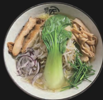
鶏塩ラーメン Shio 14,50 €

Hühnerbrühe auf feiner Salz-Basis Basis-Toppings inkl.: Chicken-Teriyaki-Stücke, Sojasprossen, Schnittlauch, rote Zwiebelringe, Menma (=eingelegte Bambusstücke), Baby-Pakchoi