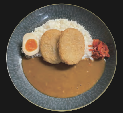
野菜コロッケカレー