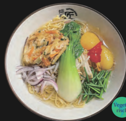
ベジ塩ラーメン Veggie Shio 14,50€

(auch vegan mögl. mit Vollkorn-Nudeln und Age Tofu statt Veggie Tempura)