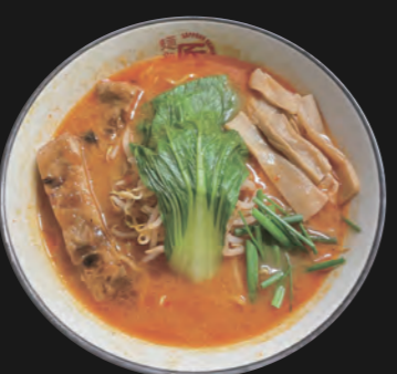
オロチョン味噌ラーメン Spicy Miso 16,30 €

Hühnerbrühe auf würziger Miso-Basis (jap. Sojabohnenpaste) Basis-Toppings inkl.: Chicken-Teriyaki-Stücke, Sojasprossen, Schnittlauch, rote Zwiebelringe, Wakame-Algen, Menma (=eingelegte Bambusstücke), Baby-Pakchoi, Mais, Butter