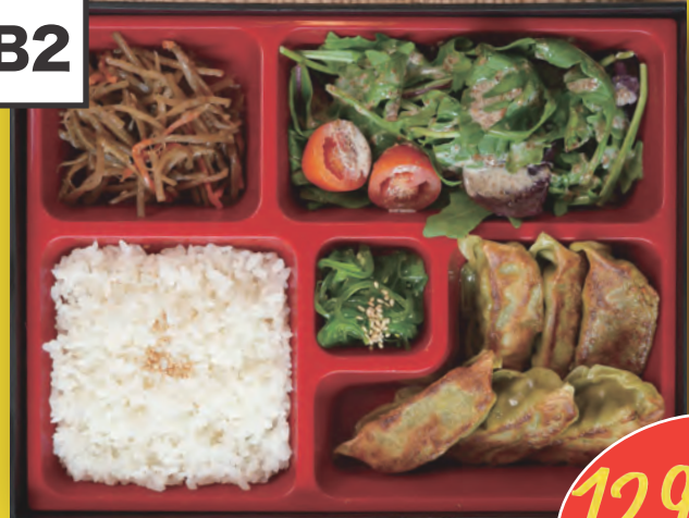
Vegan Gyoza Bento 6st. Vegane Teigtaschen