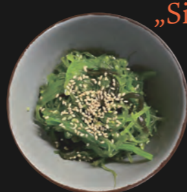
ゴマわかめ - Goma Wakame -

scharf eingelegter Chinakohl (kalt serviert) - 4,30 €