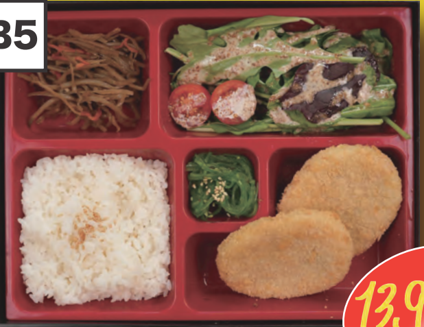
Yasai Korokke Bento 2st. Japanische Gemüse Krokette