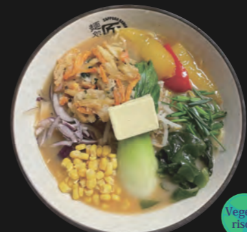
札幌ベジ味噌バターラーメン Sapporo Veggie Miso Butter Ramen 16,50 €

Hühnerbrühe auf kräftig-würziger und scharfer Miso-Basis veredelt mit einer aromatischen Sesam-Chili-Paste Basis-Toppings inkl.: Ajitama/Ei, Chili gewürztes Hähnchenhack, Sojasprossen, Schnittlauch, Baby-Pakchoi, Erdnüsse