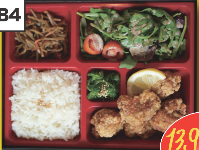
Karaage Bento 5st. Frittiertes Hähnchenfleisch