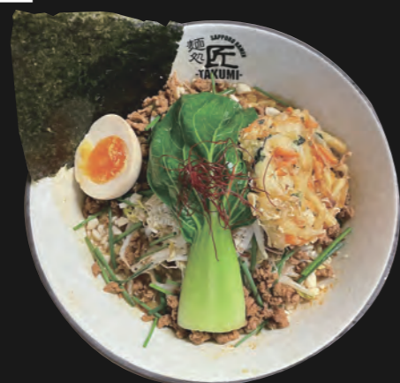
ベジドライ坦々麺 Veggie Dry TanTan - Ramen 16,80 €

auf kräftig würziger und scharfer Miso Basis veredelt mit einer aromatischen Sesam-Chili Paste ohne Suppe zusätzlich mit Su (japanischen Reissessig) Basis Topping inkl. Ajitama/ Ei, Chili gewürztes Hähnchenhack, Sojasprossen, Schnittlauch, Baby Pakchoi, gehackte Erdnüsse und 2 Stücke Karaage 19,00€