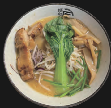
味噌ラーメン Miso 15,30 €

Hühnerbrühe auf feiner Salz-Basis Basis-Toppings inkl.: Chicken-Teriyaki-Stücke, Sojasprossen, Schnittlauch, rote Zwiebelringe, Menma (=eingelegte Bambusstücke), Baby-Pakchoi