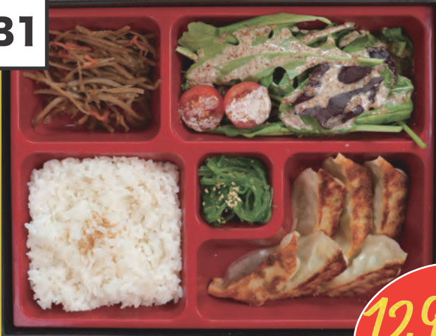
Chicken Gyoza Bento 6st. Chicken/Gemüse Teigtaschen