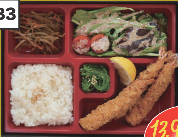
Ebi Furai Bento 3st. Frittierte Garnele in Pankoteig