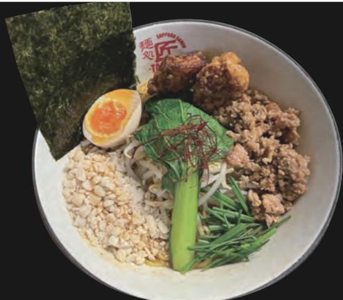
ドライ坦々麺 Dry TanTan - Ramen 16,80 €

auf kräftig würziger und scharfer Miso Basis veredelt mit einer aromatischen Sesam-Chili Paste ohne Suppe zusätzlich mit Su (japanischen Reissessig) Basis Topping inkl. Ajitama/ Ei, Chili gewürztes Hähnchenhack, Sojasprossen, Schnittlauch, Baby Pakchoi, gehackte Erdnüsse und 2 Stücke Karaage 19,00€