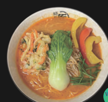
ベジスパイシー味噌ラーメン Veggie Spicy Miso 16,30 €

Kombu-Algen-Brühe auf würziger Miso-Basis (jap. Sojabohnenpaste) Basis-Toppings inkl.: Veggie-Tempura-Stück, Paprika, Sojasprossen, Schnittlauch, rote Zwiebelringe, Baby Pakchoi, Butter, Mais, Wakame-Algen