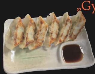
餃子 & ベジ餃子 Gyoza