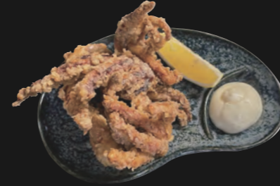
たこ唐揚げ Tako Karaage

Frittierte pikante Oktopusstücke nach japanischer Art 8,60 €