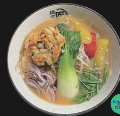
ベジ味噌ラーメン Veggie Miso 15,30 €

Kombu-Algen-Brühe auf feiner Salz-Basis Basis-Toppings inkl.: Veggie-Tempura-Stück, Sojasprossen, Schnittlauch, rote Zwiebelringe, Paprika, Baby-Pakchoi