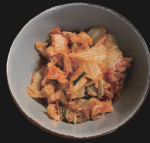
キムチ - Kimchi -

scharf eingelegter Chinakohl (kalt serviert) - 4,30 €