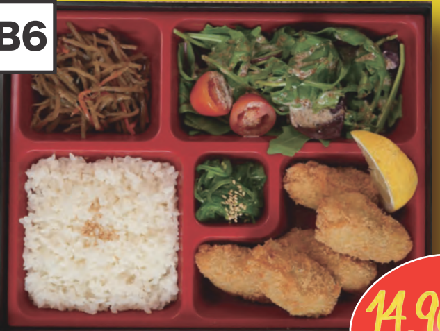
Kaki Furai Bento 5st. Frittierte Austern in Pankoteig