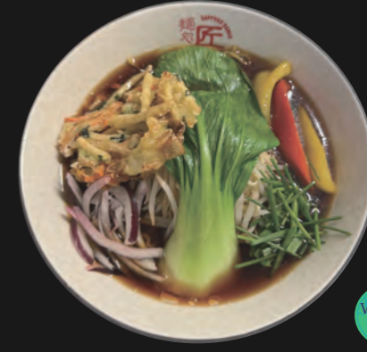
ベジ醤油ラーメン Veggie Shoyu 14,80 €

Kombu-Algen-Brühe auf würziger Miso-Basis (jap. Sojabohnenpaste) Basis-Toppings inkl.: Veggie-Tempura-Stück, Sojasprossen, Schnittlauch, rote Zwiebelringe, Paprika, Baby-Pakchoi