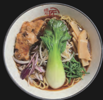
醤油ラーメン Shoyu 14,80 €

Hühnerbrühe auf würziger Miso-Basis (jap. Sojabohnenpaste) Basis-Toppings inkl.: Chicken-Teriyaki-Stücke, Sojasprossen, Schnittlauch, rote Zwiebelringe, Menma (=eingelegte Bambusstücke), Baby-Pakchoi