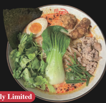
麻辣鶏白湯 / 唐揚げ麻辣鶏白湯ラーメン Mala Nouko Ramen 18,00 € (ohne Karaage) Karaage Mala Nouko Ramen 19,70 €

Nouko Ramen - Unsere Spezialität mit extra lang eingekochter kräftiger Brühe Basis-Toppings inkl.: Ajitama/Ei, Hähnchenhack gebraten, Sojasprossen, Schnittlauch, rote Zwiebelringe, Norialgenblatt (optional mit 2 St. Karaage)