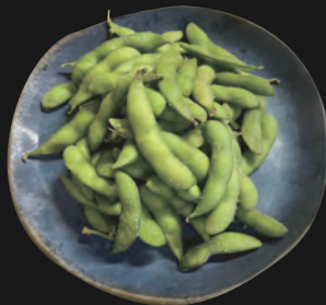
枝豆 - Edamame -

junge Sojabohnen mit Meersalz bestreut - 4,50 €